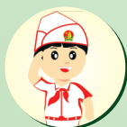
Đội trưởng NÔNG VĂN ĐẼN Bí danh: Kim Đồng